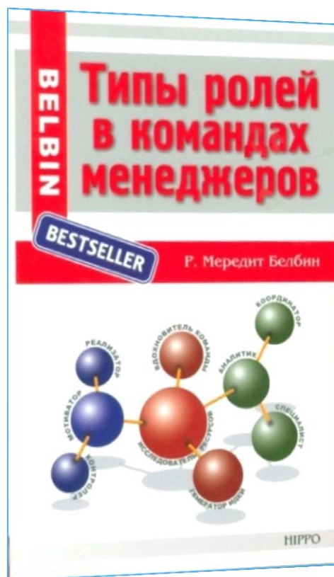
Типы ролей в командах менеджеров

Команды менеджеров Как объяснить их успех или неудачу