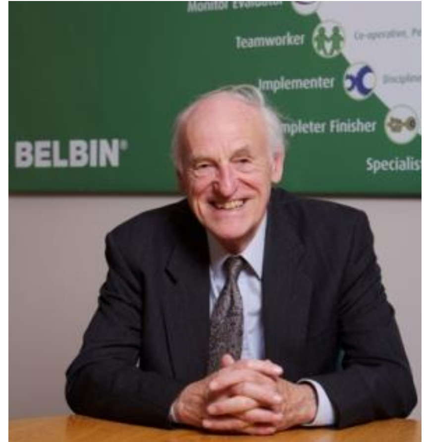
Рэймонд Мередит Белбин